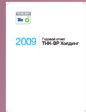
ТНК-ВР 2006 - 2009