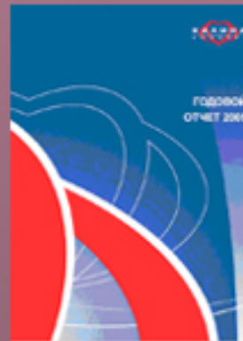
Концерн Калина 2005