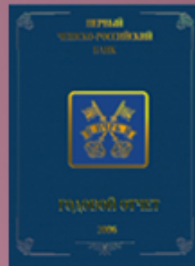
ПЧРБ 2005, 2006