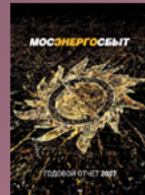
Мосэнергосбыт 2006, 2007, 2009