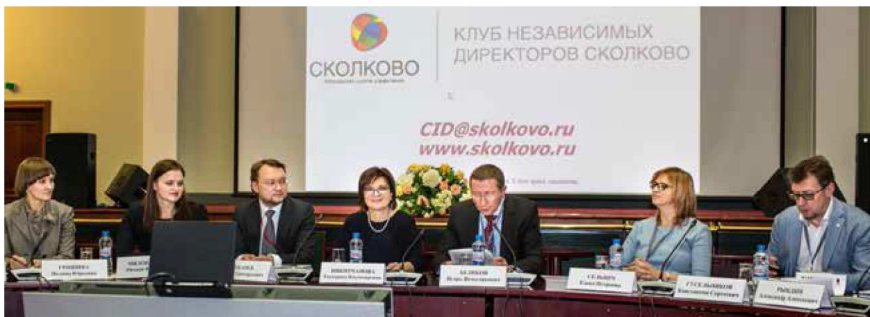
В Конгресс-центре ТПП РФ состоялся XIV Национальный (объединенный) конгресс профессиональных корпоративных директоров