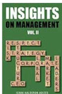
Размышления о менеджменте, часть 2