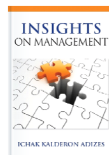
Размышления о менеджменте