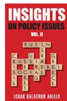
Размышления о политике, часть 2