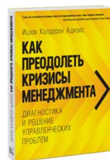
Как преодолеть кризисы менеджмента. Диагностика и решение управленческих проблем