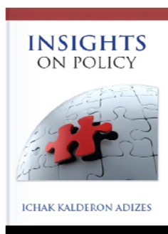
Размышления о политике