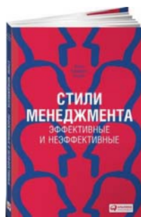
Стили менеджмента – эффективные и неэффективные