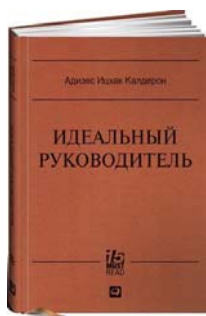
Идеальный руководитель: Почему им нельзя стать и что из этого следует