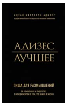
Адизес. Лучшее. Пища для размышлений. Об изменениях и лидерстве, о менеджменте и о том, что важно в жизни